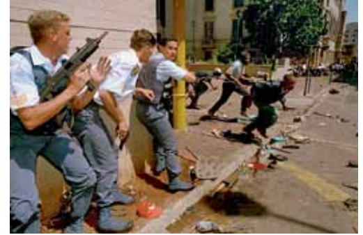
Bruderkrieg: Unruhen in Johannesburg, 1994.