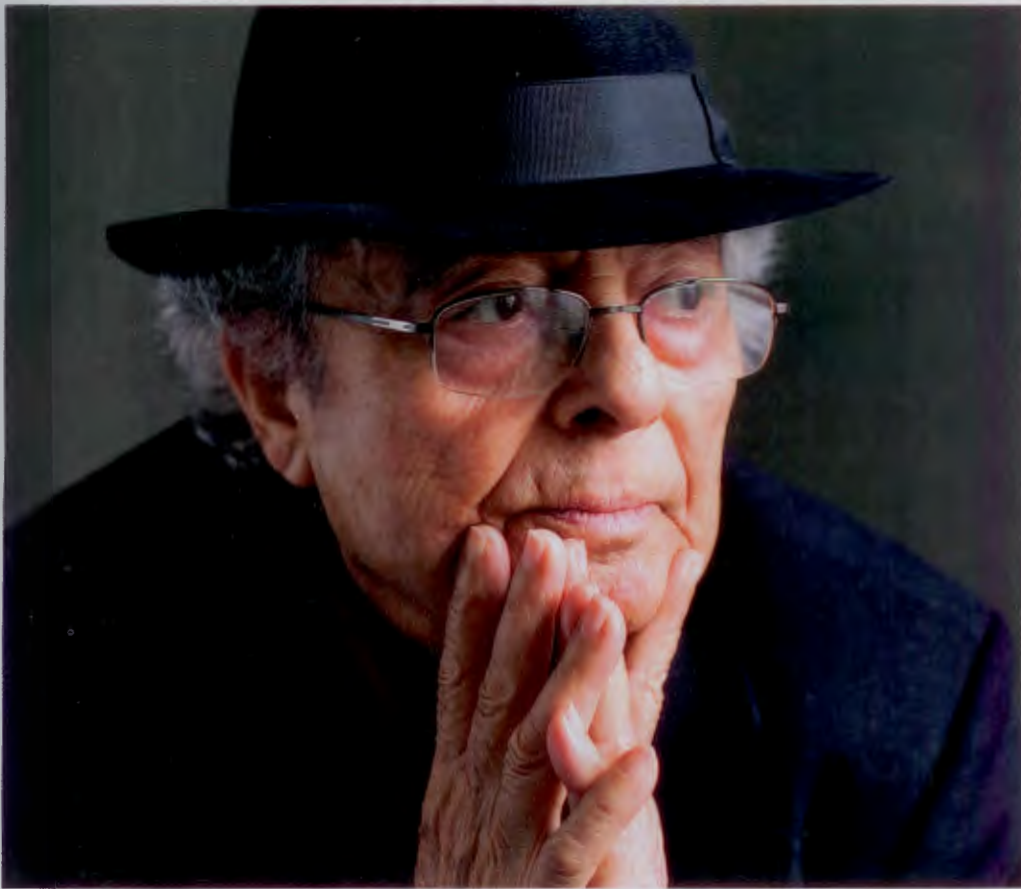
«Ich habe die leise Hoffnung, die Menschen lernen aus ihren Fehlern»: Autor Adonis. Seite 58