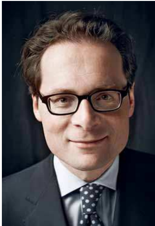
Die Gesetze des geringeren Übels.

Man muss also das Kapitel Südafrika und die Position des Westens gegenüber dem antidemokratischen Apartheid-Staat vor dem Hintergrund des Kalten Kriegs beurteilen. Gerade in den Medien hat es sich eingebürgert, den Kommunismus derart zu verharmlosen, dass man sich nicht mehr vorstellen kann, welche begründeten und berechtigten Ängste gegenüber dieser Schreckensideologie vor und nach dem Zweiten Weltkrieg bestanden haben. An der Konfliktnaht dieses Weltbürgerkriegs