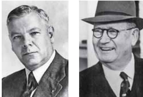
Architekten der Apartheid: Verwoerd, Malan.