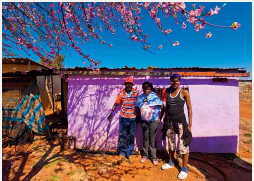
Leben in Wellblechhütten: Slum in der Nähe von Johannesburg.

Mit Sicherheit wird der ANC bei den Parlamentswahlen 2014 sowohl an liberale Oppositionsparteien wie an eine neue radikal-sozialistische Partei Stimmen verlieren. Es ist aber damit zu rechnen, dass der ANC eine regierungsfähige Stimmenmehrheit erhält, und ebenso wahrscheinlich ist, dass Zuma eine zweite Amtsperiode absolviert. Viel besser wäre es, wenn Zumas designierter Nachfolger, Cyril Ramaphosa, ein vom Gewerkschaftsführer zum Multimillionär mutierter Unternehmer, das Land übernehmen würde. Auf diese Option deutet aber nichts hin. Werner Vogt ○