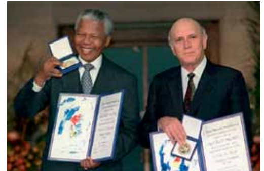
Friedensnobelpreis 1993: Mandela und de Klerk.

mit dem südafrikanischen Big Business vom kommunistischen Ballast befreien konnte, so dass der Horror vieler Weissen – eine blutige Revolution – aus den Köpfen verschwand. Im selben Ausmass, wie die Sowjetunion im Zerfallsprozess signalisierte, dass sie den ANC im bewaffneten Kampf nicht mehr unterstützen würde (aus Geldmangel und aufgrund einer absoluten Chancenlosigkeit), übten England und die USA massivsten Druck auf das Apartheidregime aus. Was man als «Wunder von Südafrika» bezeichnen kann, hatte mehr Väter als nur de Klerk und Mandela. Hinter ihnen standen viele besonnene Köpfe. General Constand Viljoen als Vorkämpfer für die Afrikaner, die plötzlich Angst hatten um ihre Kultur, war nur einer von ihnen.