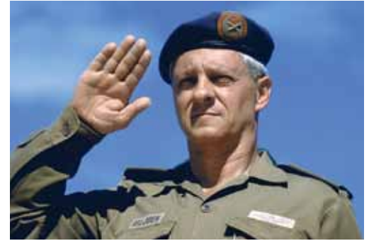
Besonnener Kopf: General Constand Viljoen.