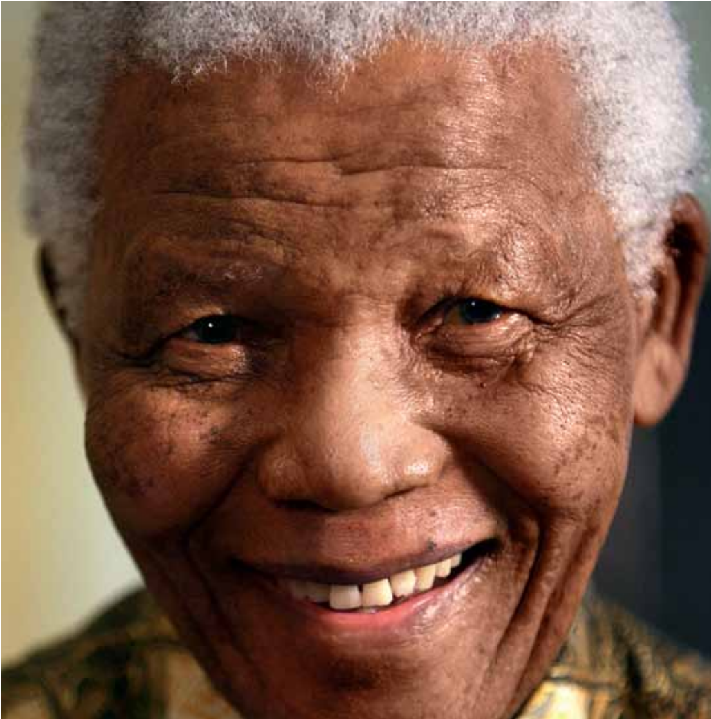
«Dear Elizabeth»: Mandela zelebrierte die Tabubrüche.

Vielleicht war Madiba gerade deshalb von ausserlesener Galanterie gegenüber schönen Frauen und von rührender Spontaneität in Bezug auf kleine Kinder, weil sie ihm jahrzehntelang gefehlt hatten. Gleichzeitig war er von jenem schelmischen Schalk desjenigen, der weiss, dass er mit allem davonkommt. Er pflegte folglich auch den Tabu-Bruch mit gesellschaftlichen Konventionen. Ein harmloses Beispiel: Ein deutsches Korrespondentenehepaar steht mit dem Baby vor einer Schule, die soeben von Mandela eingeweiht worden ist. Der Präsident kommt heraus und sieht Eltern und Kind. Spontan geht er auf sie zu, macht ein Kompliment für das schöne Baby und fragt unverblümt: «Stillen Sie ihn?»