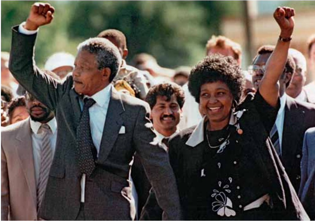
Nach 27 Jahren Haft: Mandela mit Ehefrau Winnie am Tag seiner Freilassung, 11. Februar 1990.