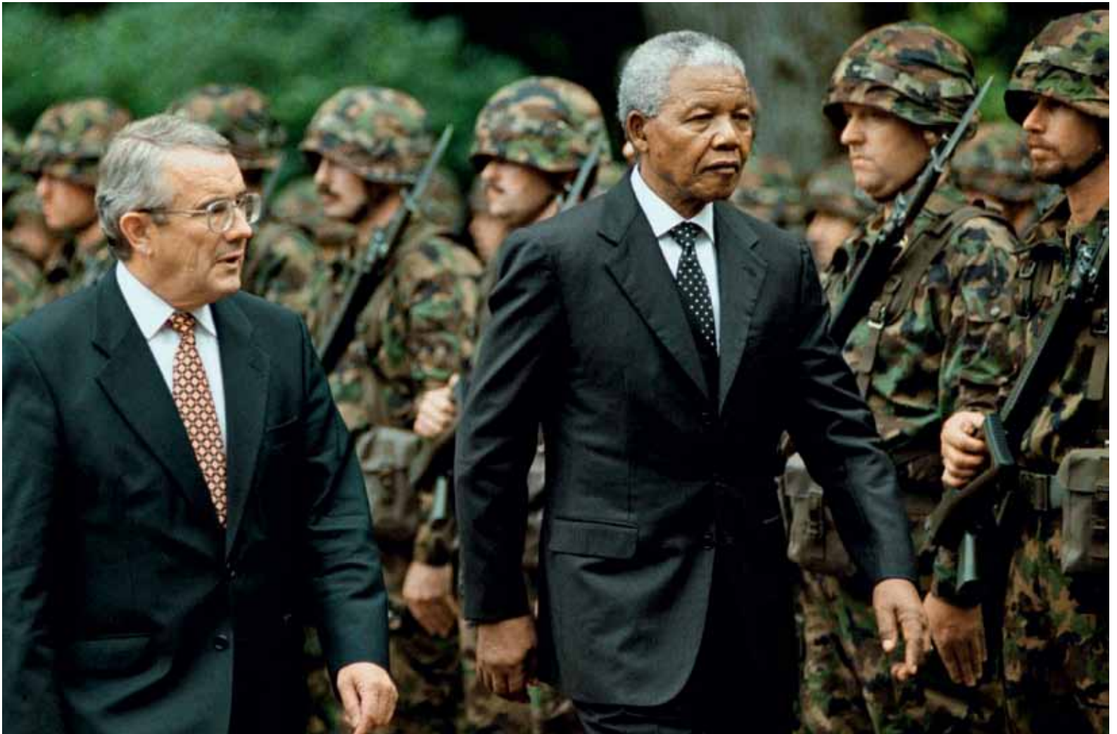
Militärische Ehren: Staatsempfang mit Bundesrat Arnold Koller auf dem Landgut Lohn in Kehrsatz, 1997.

lassen. Pretoria hatte einen Schuss vor den Bug bekommen, keine Breitseite.