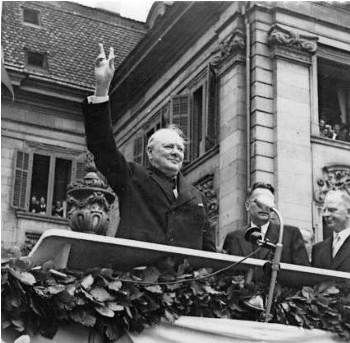
«Victory!»: Churchill vor dem Zunfthaus zur Meisen.