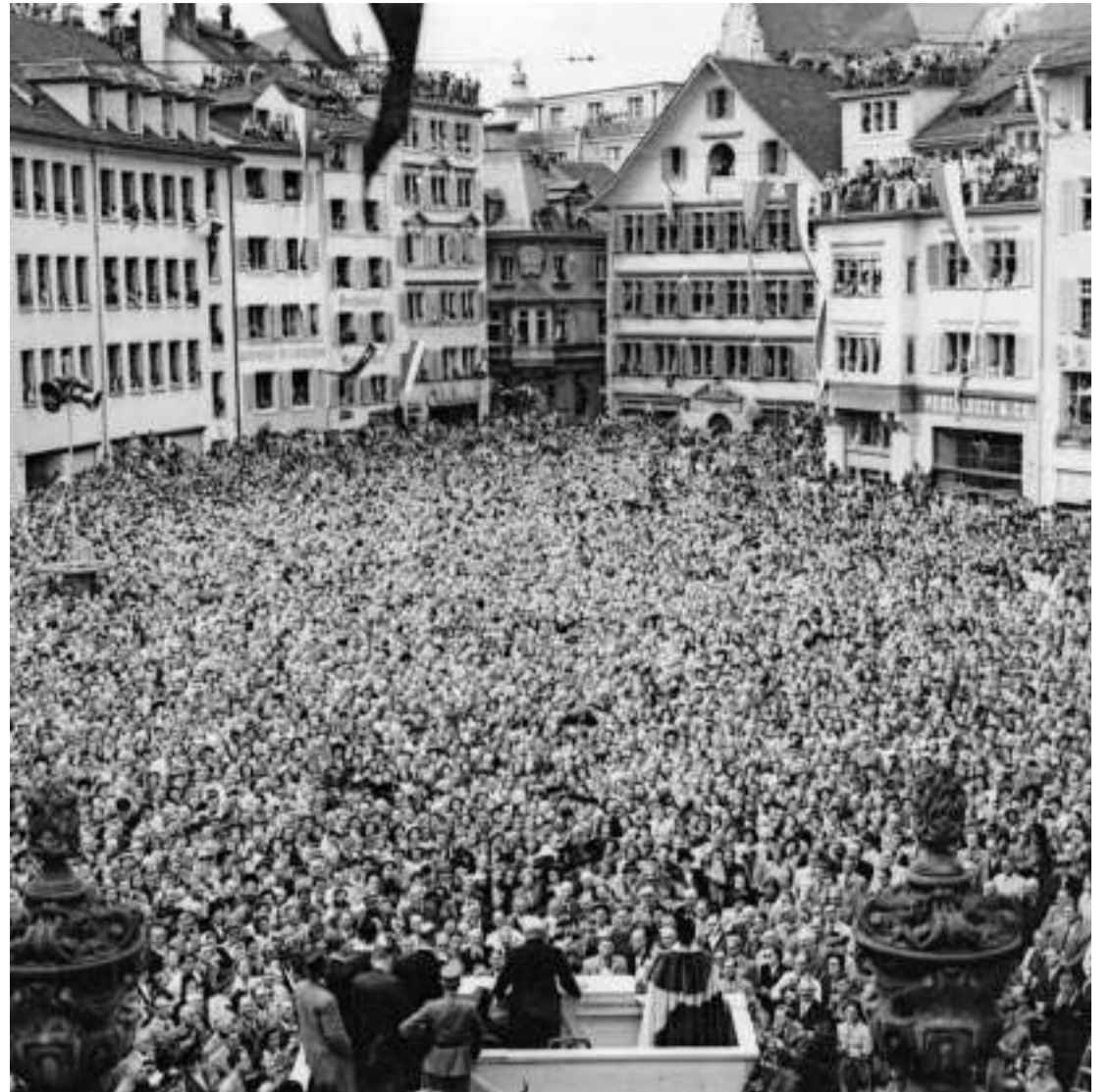
Auf den Dachterrassen, in den Fenstern, auf dem Platz: begeisterte Zürcher auf dem Münsterhof.