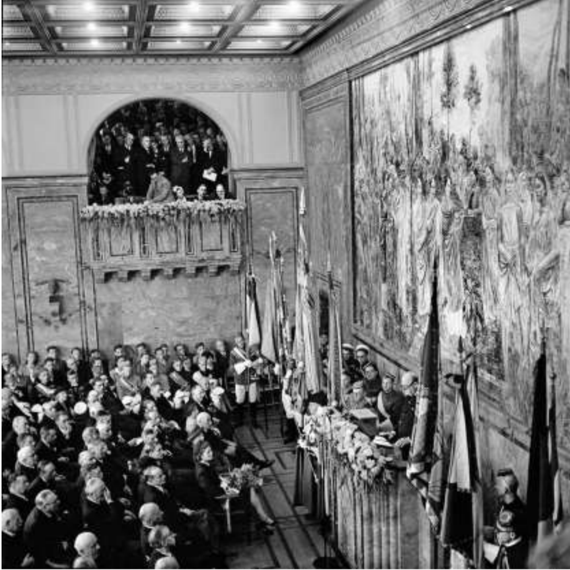
«Let Europe arise» – Churchill hält seine berühmt gewordene Rede in der Aula der Universität.