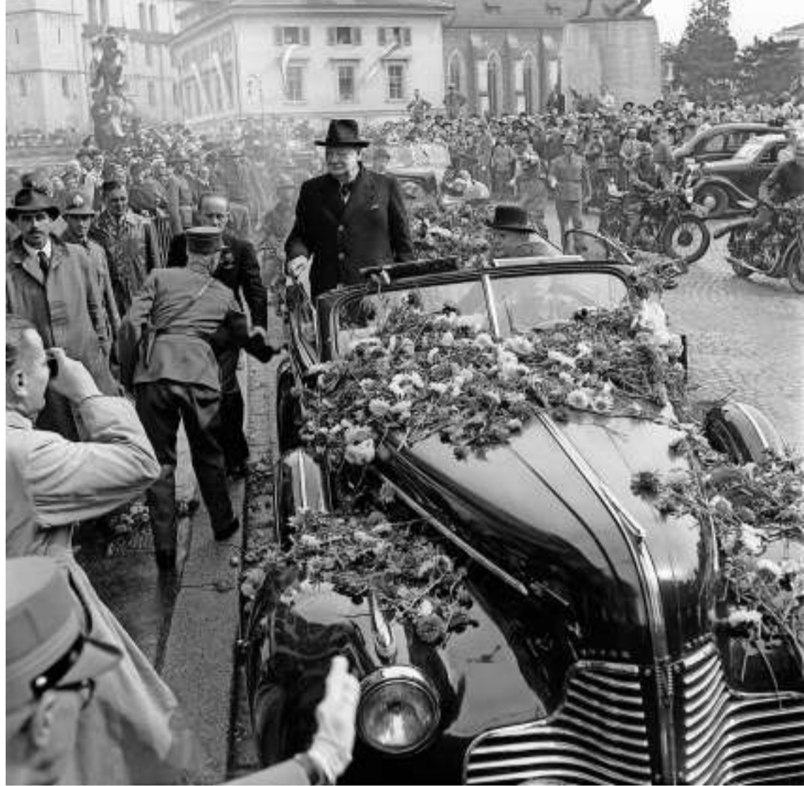
Triumphale Fahrt im offenen Wagen durch die Zürcher Innenstadt.